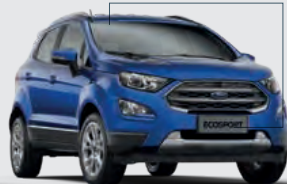
Shown in Blue Lightning*