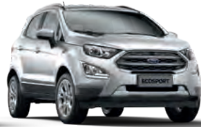
Moon dust Silver*