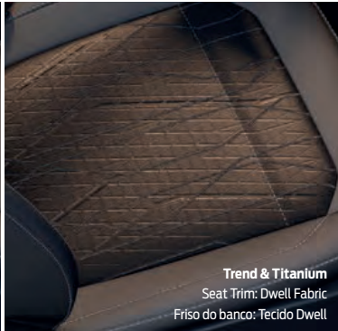
Trend & Titanium

Seat Trim: Lanai Fabric Frísio do banco: Tecido Lanai