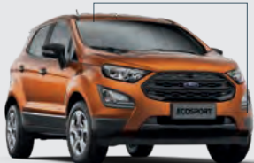
Shown in Canyon Ridge*