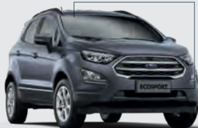
Shown in Smoke*