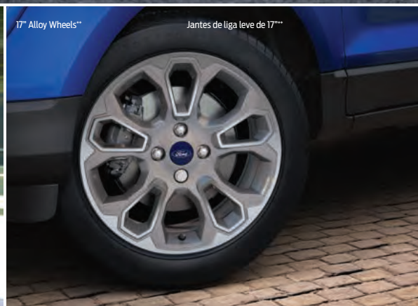
17" Alloy Wheels**